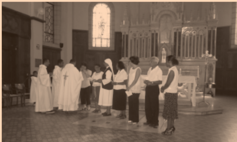
Cérémonie de remise de croix de la Communion à la Cathédrale.

Bulletin de liaison pour le service du deuil et de l'espérance