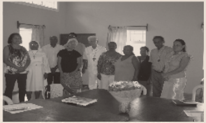
CONSEIL DIOCÉSAIN COMMUNION LAZARE - CDCL

C e fut une grande joie pour moi après la mise en place du comité diocésain nous avons visité toutes les équipes en région au nombre de 7. Un calendrier de visite fut établi pour la mise en place de la fraternité régionale de la communion Lazare. Cette expérience m'a fait goûter la joie de l'appartenance à la communion Lazare. Les membres étaient heureux de se retrouver en région et de partager leur vécu, leur expérience et leur témoignage. L'importance de ses rencontres régionales nous permet de vivre la fraternité et de partager nos expériences et de nous former ensemble. Les membres ont compris l'importance de se rencontrer mensuellement et en région. La spiritualité de la communion est vécue et contribue à mettre les membres au service de l'Église pour accompagner les familles en ce moment de deuil. Donner une parole d'espérance, de compassion aux personnes que nous accompagnons.